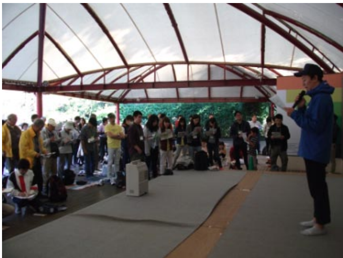
閉会式 クイズ回答と賞品選び