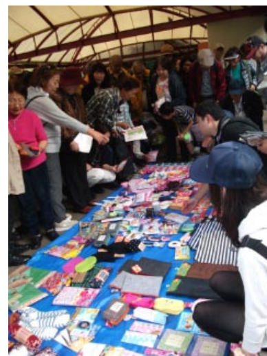
閉会式 クイズ回答と賞品選び