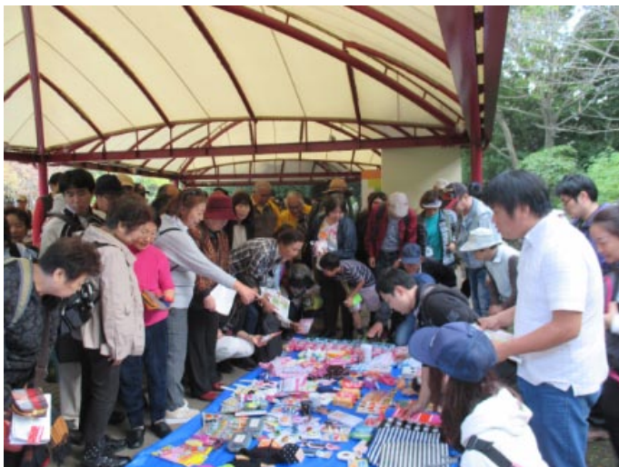
閉会式 クイズ回答と賞品選び