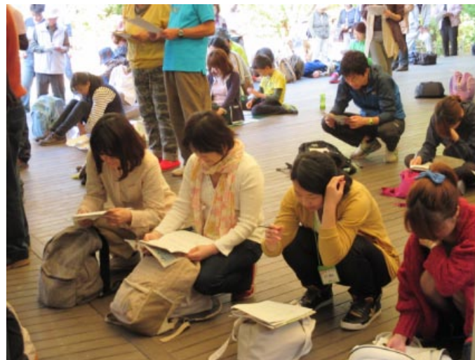
閉会式 クイズ回答と賞品選び