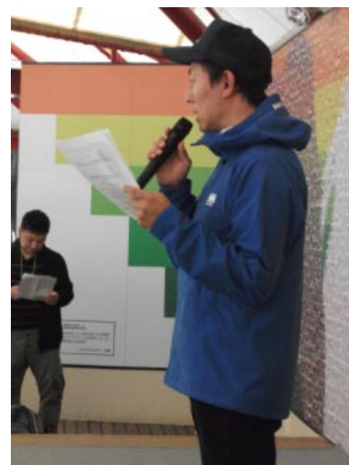
閉会式 クイズ回答と賞品選び