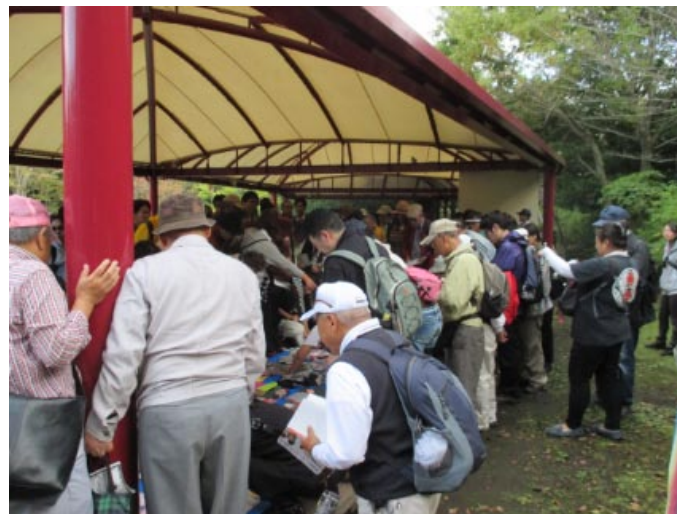
閉会式 クイズ回答と賞品選び