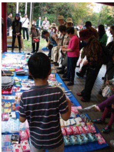
閉会式 クイズ回答と賞品選び