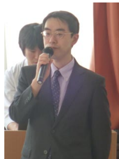
質疑応答など 津村副会長