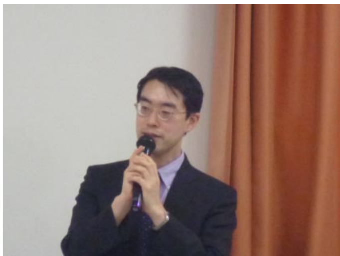
質疑応答など 津村副会長