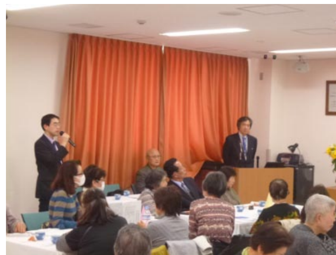
質疑応答など 津村副会長