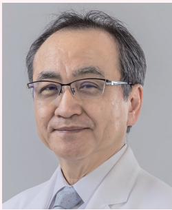
第42回日本糖尿病・妊娠学会 年次学術集会長