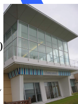
鎌倉プリンスホテル